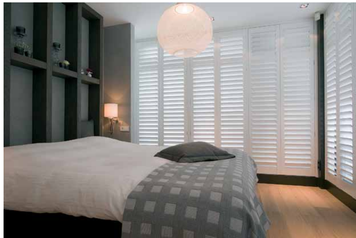
Pajaco Interieurbouw verzorgde de maatwerkoplossingen in het gehele interieur

ruwe materialen gemaakt. Granieten deuren bijvoorbeeld, en veel grof eiken. Dat zie je doorgaans eerder in een stube, niet in zo'n modern huis. Een ander soort verrassing, maar daarom zeker niet minder mooi.