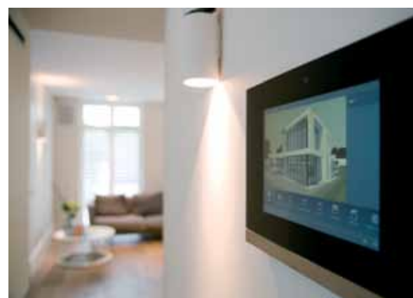
De domotica, verlichting en het sonos installatiesysteem zijn geheel verzorgd door Beda Elektro