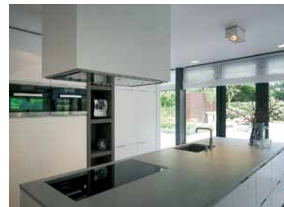
Ook het Beton Ciré aanrechtblad is door Frits Kool stukadoors vervaardigd